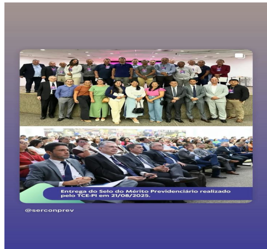
Entrega do Selo de Mérito Previdenciário realizado pelo TCS-PI em 21/08/2025